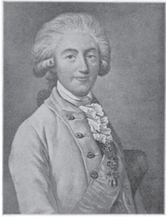
Prinz Maximilian Chef des Regiments von 1764 bis 1838