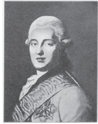
Kurfürst Friedrich August III. Chef des Regiments von 1756 bis 1764