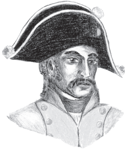
Kurfürst Friedrich August III. Chef des Regiments von 1756 bis 1764