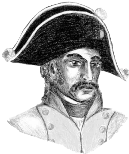
Kurfürst Friedrich August III. Chef des Regiments von 1756 bis 1764