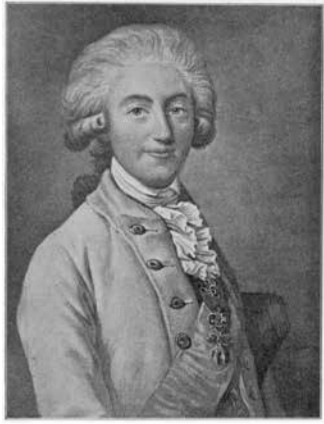
Prinz Maximilian Chef des Regiments von 1764 bis 1838